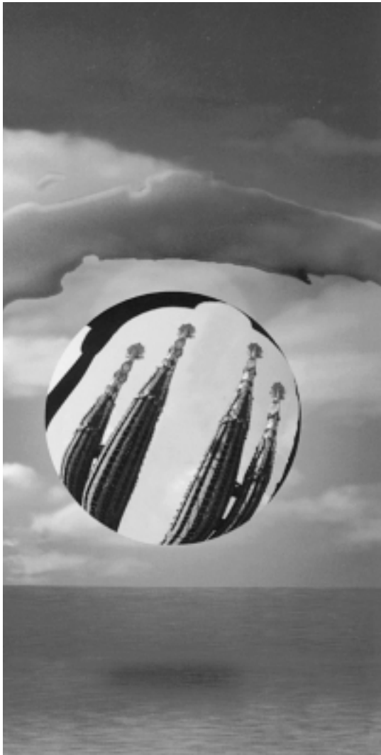
Logo de la Jornada de trasplante e implante de tejido ocular .