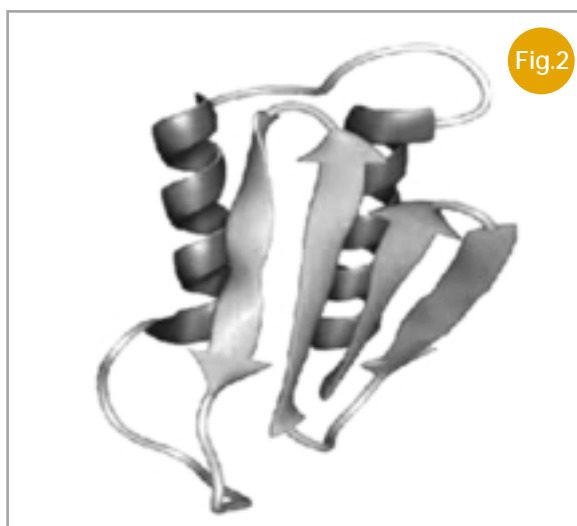
Imagen espacial del príon patológico (PrP Sc ), con parte de su estructura en forma laminar.

midales, con conservación de las funciones cognitivas hasta las fases más evolucionadas del proceso.